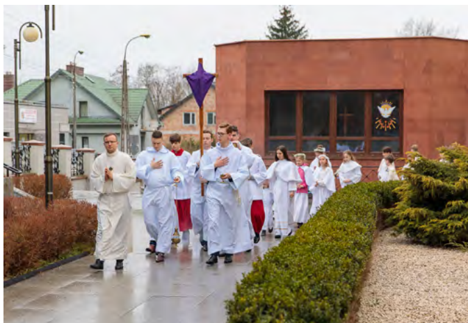
Procesja z zasłoniętym krzyżem

Polska posiada bardzo szeroką tradycję nabożeństw (np. gorzkie żale). Nie poświęciłem im jednak tutaj uwagi ze względu na to, że nie są one liturgią, której dotyczy ten cykl.