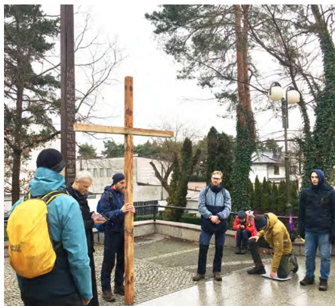
Uczestnicy Ekstremalnej Drogi Krzyżowej