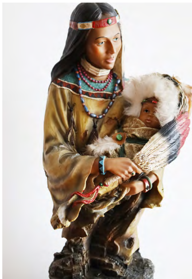
Figura ze zbiorów ks. prałata Jerzego Tyca

Ryt rzymski powstał w kulturze zachodnioeuropejskiej (i sam od wieków na nią bardzo wpływa), więc nie jest ni-