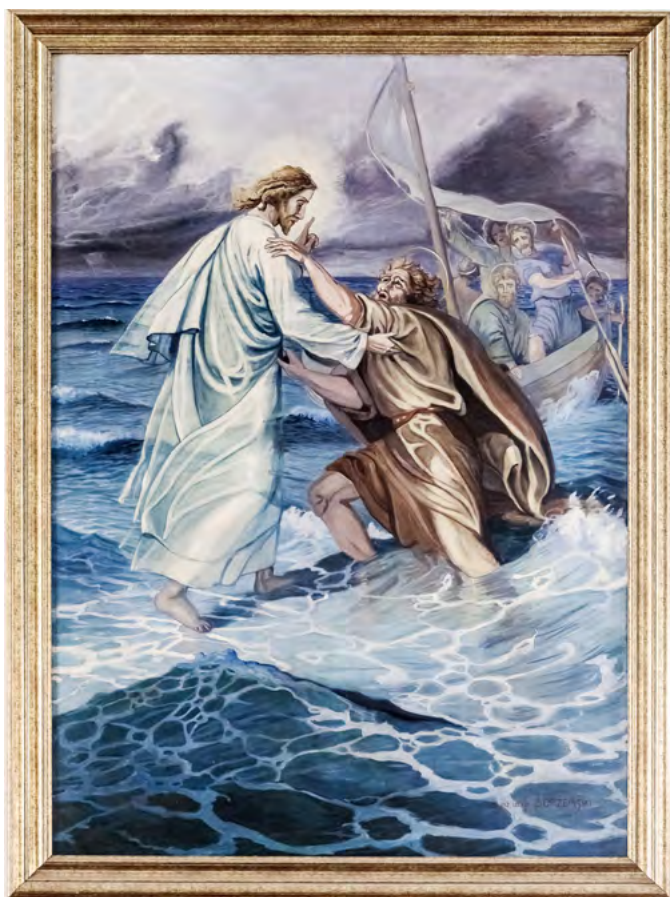
Obraz Jezusa krocącego po wodzie z naszego kościoła, fot. B. Krośkiewicz

W ostatnim czasie wszyscy zadajemy sobie pytanie o przyszłość Kościoła. Skandale, oskarżenia, odejście młodych. Wszystko to zdaje się nie napawać entuzjazmem. Czy takiego Kościoła pragnął Chrystus? I jakiej wspólnoty pragniemy my, wierni?