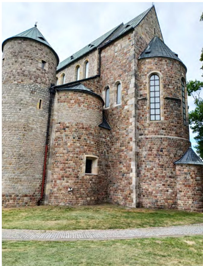
Archikolegiata w Tumie z XII wieku

Kiedy myślę o wakacjach, przychodzą mi na myśl słowa Psalmu 34: “Chcę błogosławić Pana w każdym czasie, na ustach moich zawsze Jego chwała”. Nadszedł upragniony i długo oczekiwany przez nas czas urlopów i wakacji dla naszych dzieci. Dlaczego i jak zadbać o to, by ten czas był spędzony z Panem Bogiem?