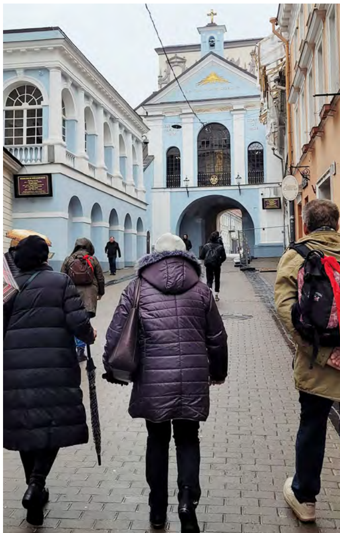
Pielgrzymka do Wilna

Spotkania Wspólnoty odbywają się raz w miesiącu (w pierwszy poniedziałek miesiąca) po mszy świętej wieczornej o godzinie 18.00, poprzedzonej modlitwą różańcową w Kaplicy o godzinie 17.00.