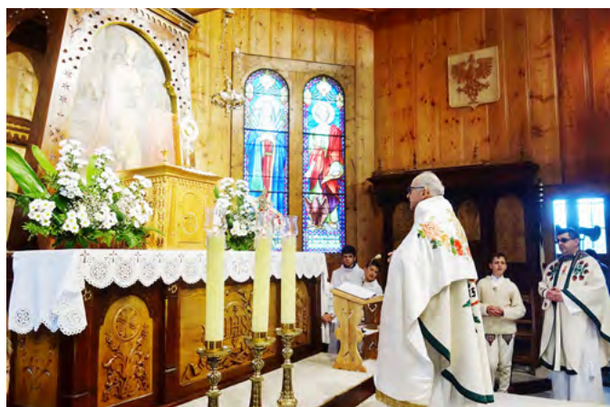
Wnętrze kościoła św. Kazimierza Królewicza w Kościelisku