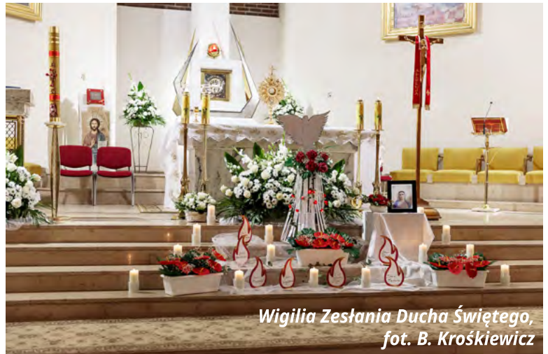
Wigilia Zesłania Ducha Świętego

W bieżącym roku ważna była praca formacyjna członków Wspólnoty. Przede wszystkim poprzez udział w rekolekcjach, kursach i seminariach. Podczas cotygodniowych spotkań modlitewnych odbywają się: konferencje tematyczne, spotkania w małych grupkach dzielenia, warsztaty modlitwy wstawienniczej, spotkania integracyjne.