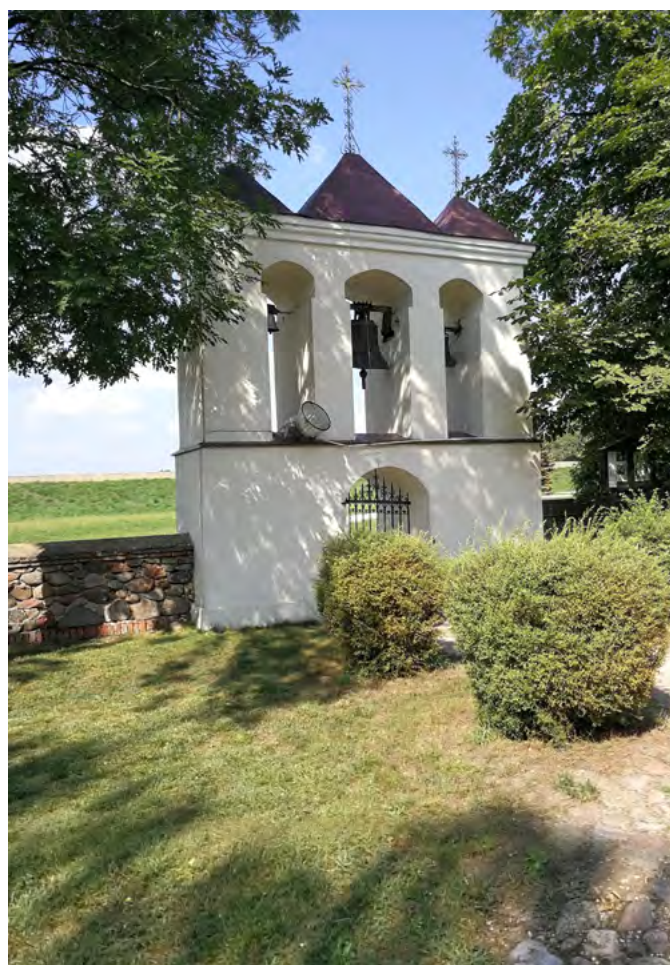
Dzwonnica przy kościele św. Marka Ewangelisty w Siedlątkowie, najmniejszej parafii w Polsce