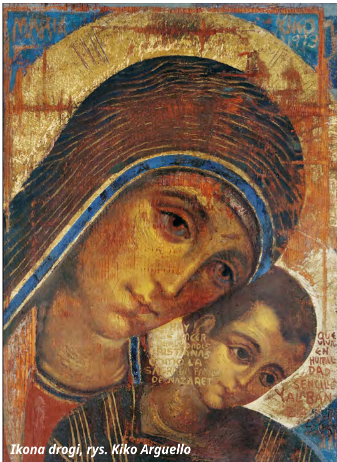
Ikona drogi, rys. Kiko Arguello

Obecnie w parafii funkcjonują 4 wspólnoty. Życie wspólnot opiera się na trójnogu: słowo Boże, liturgia, wspólnota. Każda wspólnota spotyka się minimum dwa razy w tygodniu na liturgii słowa i Eucharystii. Wspólnota podzielona jest na grupy, każda z grup po kolei przygotowuje liturgię słowa lub Eucharystię. Co 1 - 1,5 miesiąca odbywa się jedno lud dwudniowe spotkanie wspólnoty nazywane konwiencją. Ważną częścią tego spotkania jest liturgia pokutna.